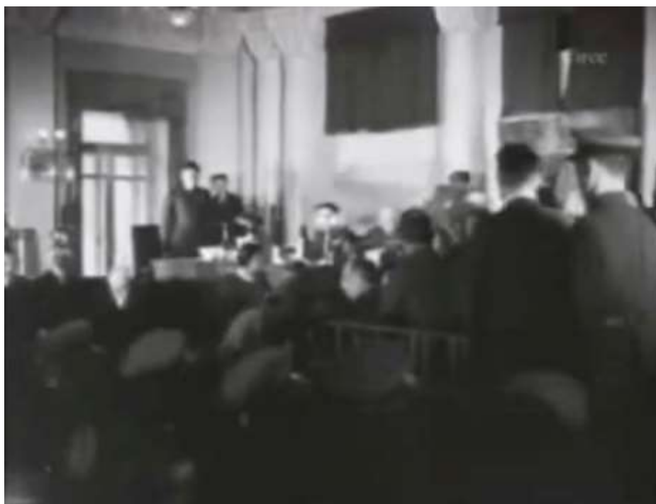
Interiör från rättegången 1938 (klipp från film)